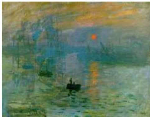
(Impression du soleil levant 1872)

(qui donne le nom du mouvement impressionniste)